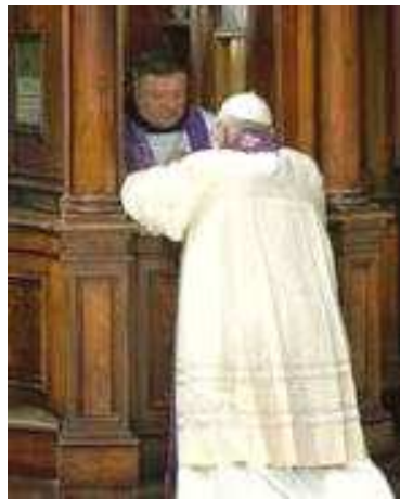
PAPA FRANCESCO SI CONFESSA

Cari fratelli e sorelle , ho pensato spesso a come la Chiesa possa rendere più evidente la sua missione di essere testimone della misericordia. E' un cammino che inizia con una conversione spirituale; e dobbiamo fare questo cammino. Per questo ho deciso di indire un Giubileo straordinario che abbia al suo centro la misericordia di Dio. Sarà un Anno Santo della Misericordia . Lo vogliamo vivere alla luce della parola del Signore: "Siate misericordiosi come il Padre" (cfr Lc 6,36).