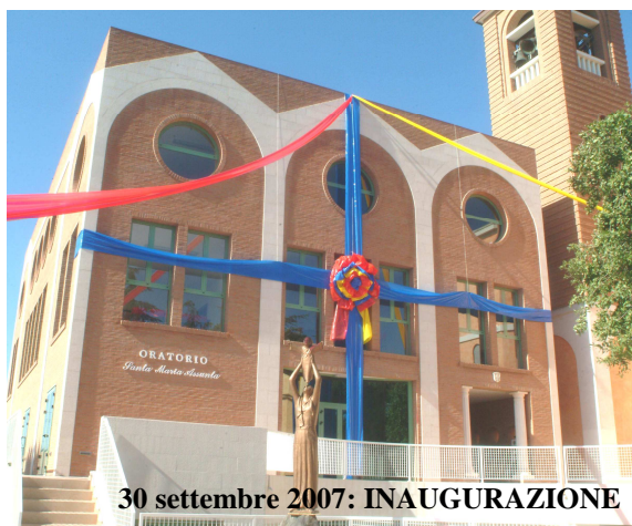
30 settembre 2007: INAUGURAZIONE