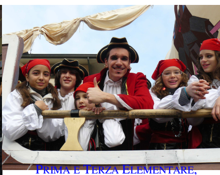
PRIMA E TERZA ELEMENTARE, CARRO DI MORCIOLA