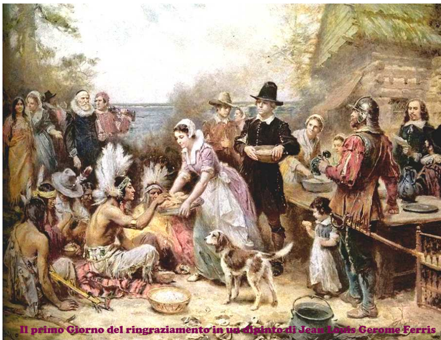
Il primo Giorno del ringraziamento in un villaggio di Jean Louis Gerome Ferris

“Poiché è il dovere di tutte le Nazioni riconoscere la provvidenza di Dio Onnipotente e obbedire alla sua volontà, di essere grati per i suoi benefici e di implorare umilmente la sua protezione e il suo favore - e poiché entrambe le Camere del Parlamento mi hanno chiesto, attraverso la loro Commissione congiunta, "di raccomandare al Popolo degli Stati Uniti una giornata di pubblico ringraziamento e preghiera da osservare riconoscendo con cuori grati i molti segnati favori di Dio Onnipotente, in modo particolare dando loro l'opportunità di stabilire pacificamente una forma di governo per la loro sicurezza e felicità."